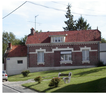
Maison existante avec ses modifications

Le montage photo de droite illustre la façon de composer une maison existante avec ses extensions ultérieures, et comment favoriser l'intégration des modifications dans la façade :