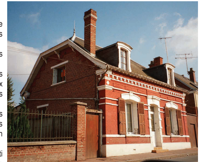
Bel exemple de bâti brique typique avec demi-croûpe en pignon, lucarnes et intéressant jeu de brique en façade

Le bâti brique de la Reconstruction, de bonne qualité, est encore omniprésent sur le territoire ; en le parcourant on peut découvrir la diversité et la créativité des différentes réponses architecturales trouvées au problème, immense, de la Reconstruction. Actuellement, ce patrimoine est globalement bien conservé mais subit des altérations nombreuses et souffre d'un entretien peu scrupuleux du respect de son identité. Le bâti agricole, tout comme l'habitat, doivent en effet faire face aux évolutions des conditions d'exploitation, modes de vie et standards de confort : les principaux changements portent sur des agrandissements ou surélévations, des modifications de percements, des remplacements de menuiseries et de volets. L'importance, la taille et la beauté même de ce bâti ancien posent le problème des modalités d'intervention et d'intégration des modifications et adjonctions nécessaires à son adaptation à la vie moderne et aux conditions d'exploitation actuelles dans un compromis entre sa restauration traditionnelle et sa modernisation. Des interventions très contemporaines peuvent être envisagées, surtout sur le bâti de grande dimension, mais elles nécessitent des compétences professionnelles avérées.