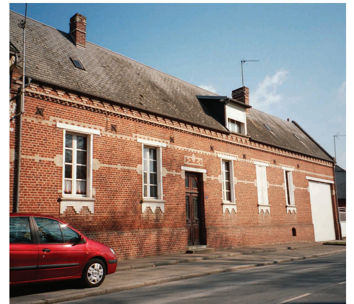
Bâti civil picard

Ce patrimoine bâti, support d'une identité commune ancrée dans le passé, est le siège de l'activité de production agricole locale et un vecteur de développement touristique pour la CCALM.