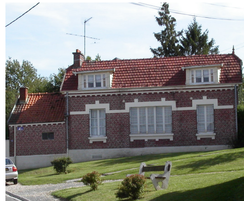
Proposition de meilleure intégration des modifications